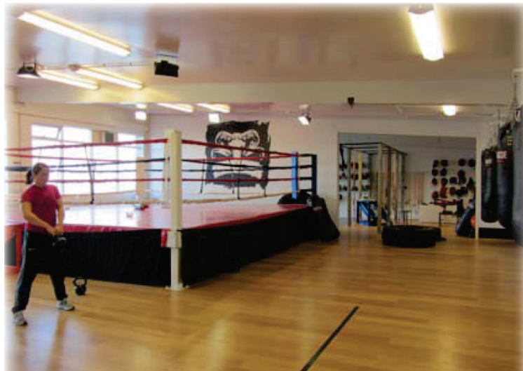
Traumhafte Ausstattung des Clubs