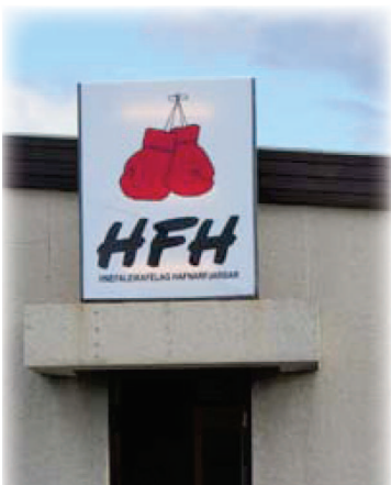
Ein kleines Schild an der Straße